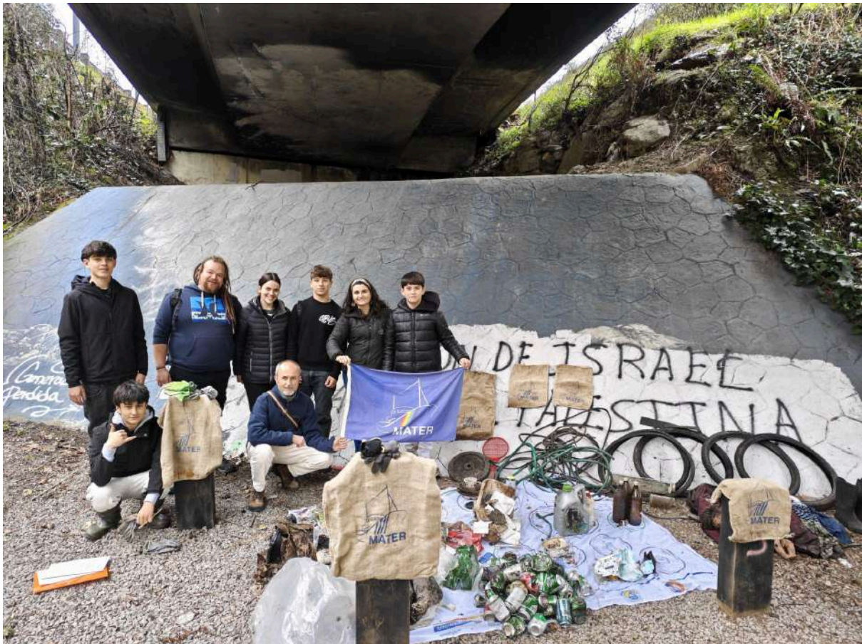
Imágenes 6-9: Residuos encontrados, recogidos y caracterizados en la cuenca del río Oiartzun a su paso por el barrio Fanderia de Errenteria. 15/03/2025

El día se presentó nublado, típico para esta fecha y acudieron a la actividad 9 personas, gracias a la difusión realizada por el canal de comunicación del ayuntamiento local de Rentería y la promoción realizada por el grupo de adolescentes “Guztion Erreka, Guztion Erronka” de 3.ESO del colegio Telleri Alde Ikastetxea. Estos jóvenes participan en el proyecto educativo promovido por MATER denominado “ Itsas Hondakinen Erronka ” en el que los y las jóvenes llevan a cabo proyectos de reducción de las basuras marinas en su localidad.