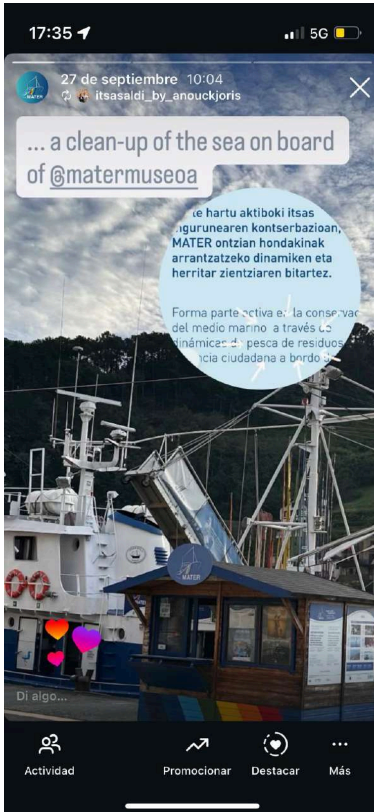
Foto 19: Story del día de la salida de pesca de basuras marinas 27/09/2025 Libera 1m2 por mares.