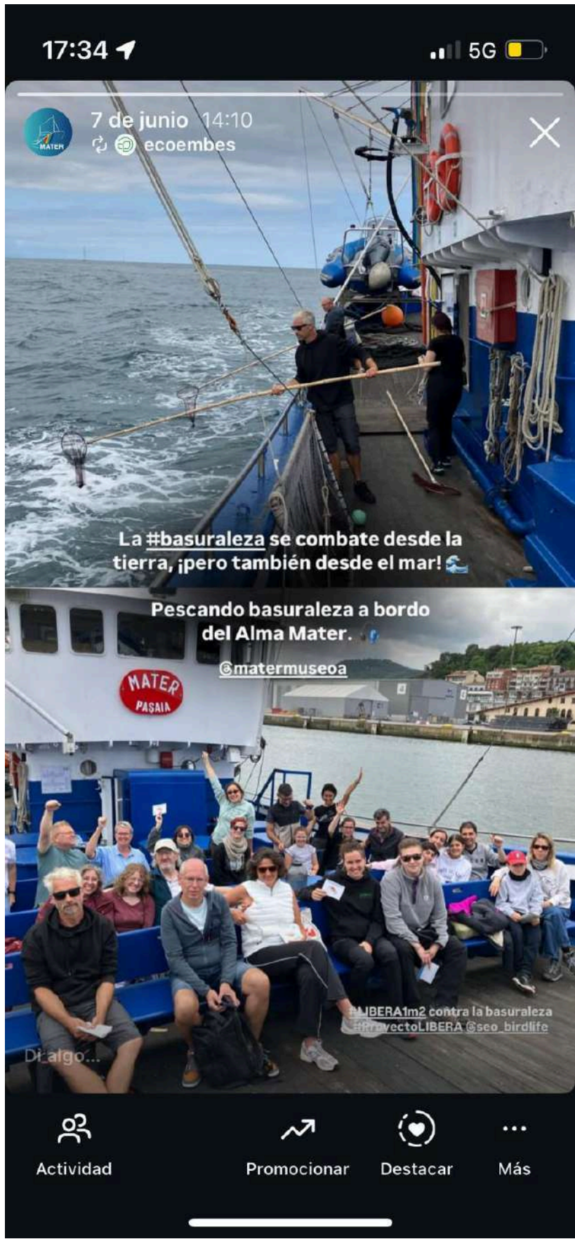
Foto 15: Publicaciones en las redes sociales de MATER el 07/06/2025