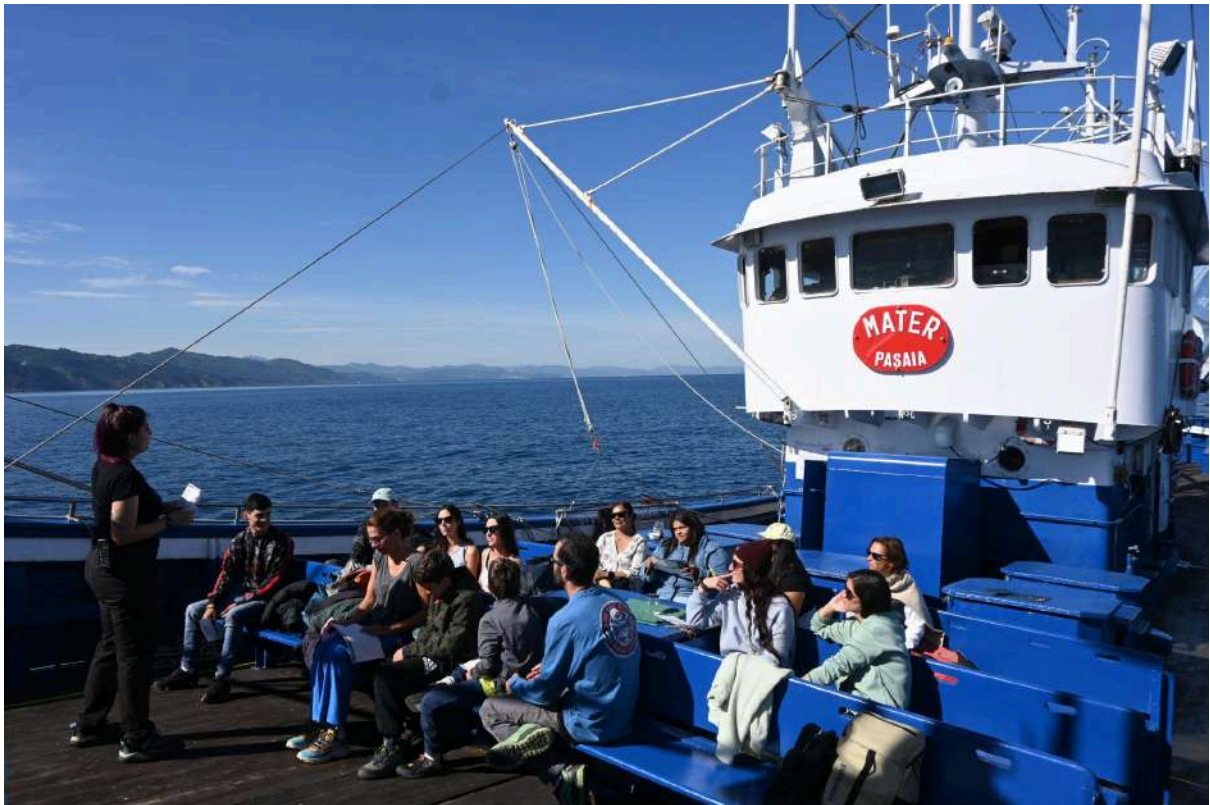
Foto 19: Explicación previa a la gincana de sensibilización de a bordo.

diversos tamaños, aunque también se pescaron un globo y un envoltorio de chuchería. La caracterización se realizó con la app Marnoba, ( https://marnoba.vertidoscero.com/collections?id=12190 ). En esta ocasión tampoco se realizó muestreo de microplásticos porque las condiciones no eran favorables pero sí se realizó una gincana participativa para profundizar en el problema y soluciones de la basura marina.