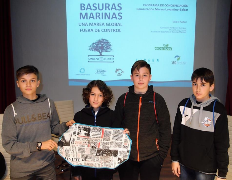
Alumnos del IES Miguel Hernández de Alhama de Murcia presentando el "EcoBoc" durante la presentación sobre basuras marinas