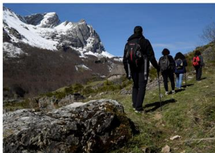
Excursionistas en montes osceros

No debemos abandonar restos de comida en general, y en particular en espacios y merenderos ubicados en entornos naturales en donde puede acumularse una mayor cantidad de desechos de fácil acceso para los animales salvajes. Estos encuentran alimento suficiente en el medio natural y no necesitan nuestra comida.