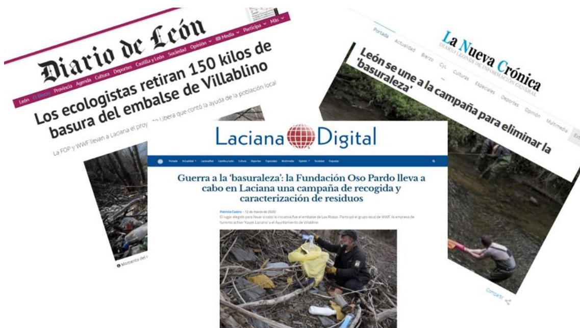
Noticias sobre la recogida en el embalse de Las Rozas en la prensa comarcal y provincial

Esta actividad fue seguida por los medios de comunicación locales, comarcales y provinciales contribuyendo a poner de relieve el tremendo impacto que los residuos abandonados en la naturaleza acaban teniendo también en el medio acuático, y en concreto en zonas próximas a poblaciones de un cierto tamaño, como era este caso.