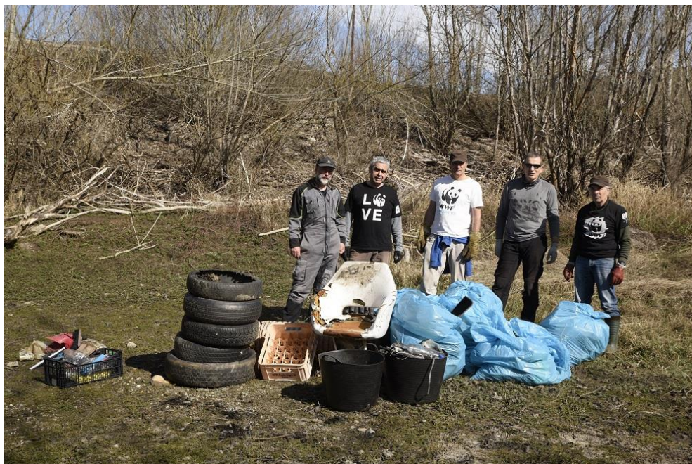
Parte del grupo participante junto a residuos encontrados en el entorno del embalse de Las Rozas, en el municipio de Villablino (León)