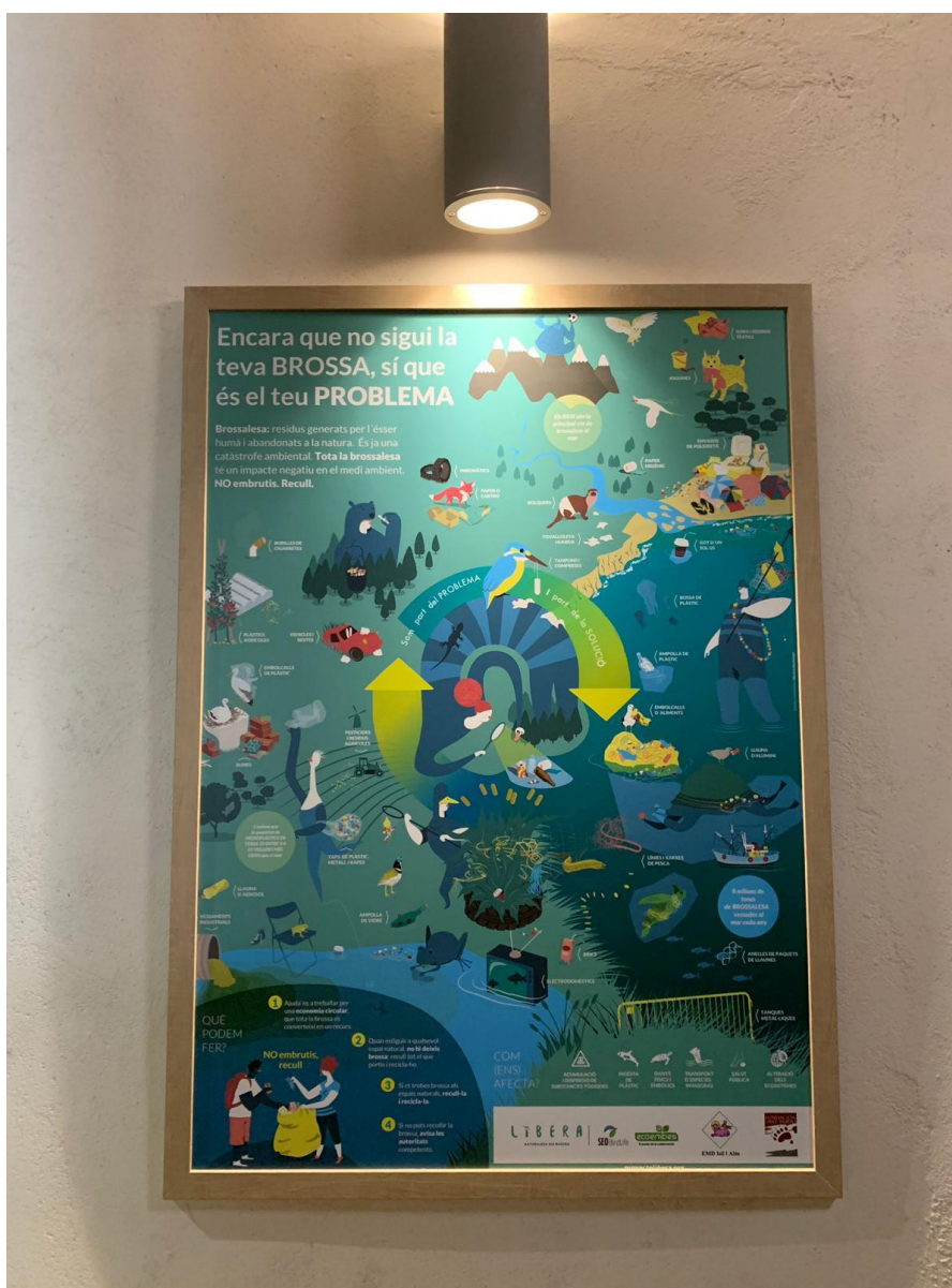
Póster enmarcado del proyecto LIBERA en la Casa del Oso en los Pirineos, en Isil, Lleida

Los materiales informativos del proyecto LIBERA permanecen colocados en lugares bien visibles de las tres Casas del Oso, y la Casa del Parque de la Montaña Palentina. En este año las Casas del Oso han estado abiertas durante los meses de verano y hasta bien entrado octubre. Las visitas se han realizado con aforo reducido y siempre guiadas debido a la pandemia, con un total de visitas para las tres Casas de 6.377 y de 6.318 para la Casa del Parque de la Montaña Palentina. Total: 12.695 visitas.