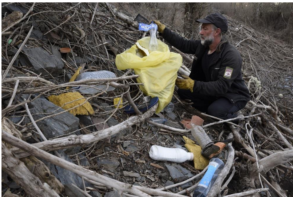
Miembro de la Patrulla FOP recogiendo envases en el entorno del embalse