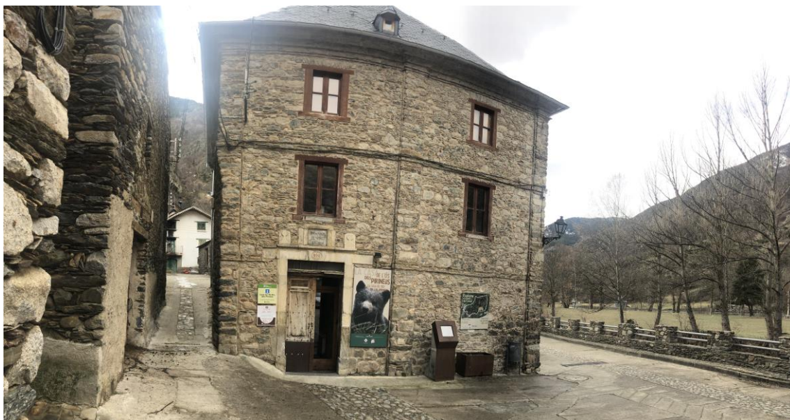
Fachada de la Casa de l'Ós Bru dels Pirineus, en Isil, Lleida

La relación de centros y participantes se detalla en el ANEXO 1 que acompaña a esta memoria.