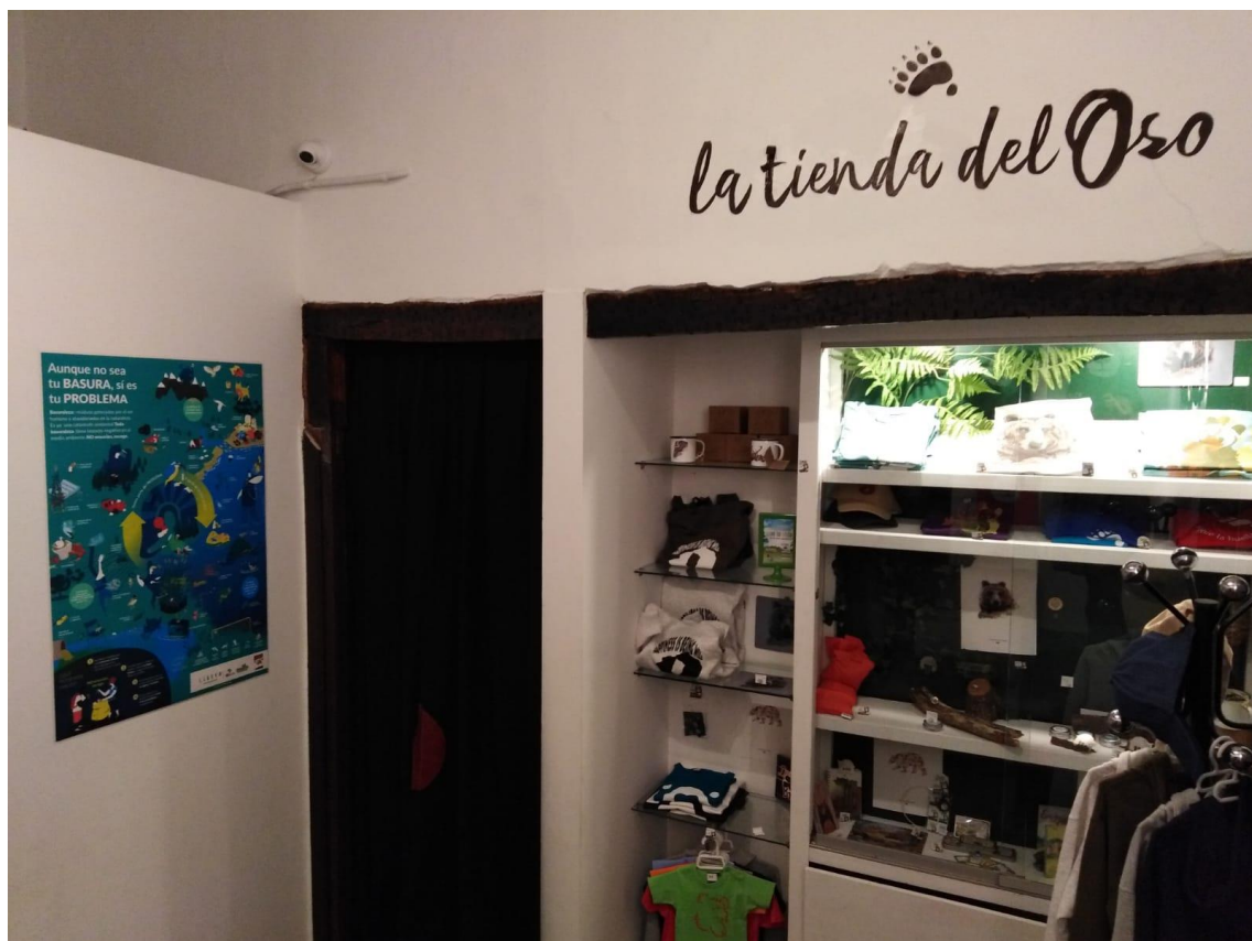
Póster de Libera en la recepción de la Casa del Oso en Liébana, Potes (Cantabria)

Además, este año se ha inaugurado en la Casa del Parque de la Montaña Palentina la muestra permanente “Zona Oso” , que integra los mejores materiales de la exposición de la antigua Casa del Oso que gestionaba la FOP en la localidad de Verdeña (Palencia) junto a elementos aportados por la Junta de Castilla y León, a través de la Fundación Patrimonio Natural. La muestra se inauguró en septiembre con presencia de varias autoridades de la Junta de Castilla y León, y se espera que sea un foco de especial atracción de visitantes a la Casa del Parque.