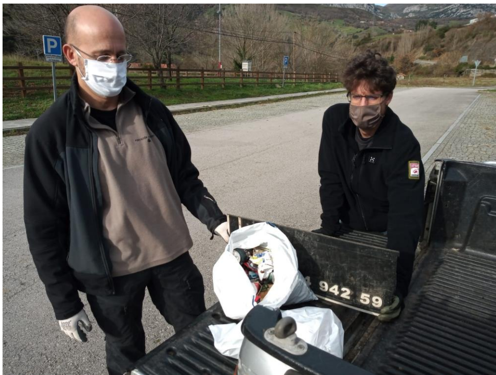
Caracterización de residuos en el aparcamiento del Centro de Visitantes del Parque Nacional de Picos de Europa (Cantabria)

- Aparcamiento del Centro del Centro de visitantes del Parque Nacional de Picos de Europa, en Tama, Cillórigo de Liébana (Cantabria). Sin acumulaciones llamativas. Se recogió alrededor de 2kg de residuos debido a la presencia de restos de madera tallada.