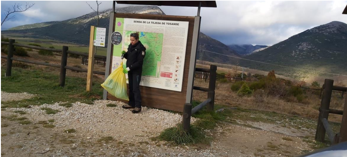
Recogida para caracterización de residuos en el Parque Natural de la Montaña Palentina (Palencia)

- Aparcamiento del Centro del Centro de visitantes del Parque Nacional de Picos de Europa, en Tama, Cillórigo de Liébana (Cantabria). Sin acumulaciones llamativas. Se recogió alrededor de 2kg de residuos debido a la presencia de restos de madera tallada.