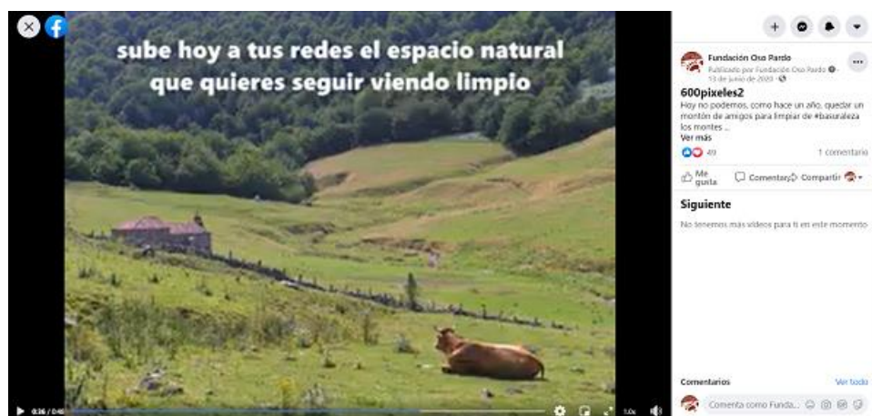
Fotograma del vídeo elaborado para la iniciativa “600 píxeles por la naturaleza”

3.1.3 “600 píxeles por la naturaleza”, 13 de junio: La participación en la recogida general colaborativa anual, que el proyecto LIBERA transformó este año en una iniciativa digital de concienciación debido a la pandemia, se realizó mediante un vídeo creado para redes sociales.