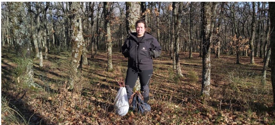
Caracterización de residuos en el Espacio Natural de los Valles Altos de Saja, Nansa y Alto Campoo (Cantabria)

- Sendero junto a la localidad de Mazandrero, en el Espacio Natural Protegido de la Red Natura 2000 Valles Altos de Saja, Nansa y Alto Campoo (Cantabria). 300M x 3m. Se recogieron algo más de 4 kg de residuos.