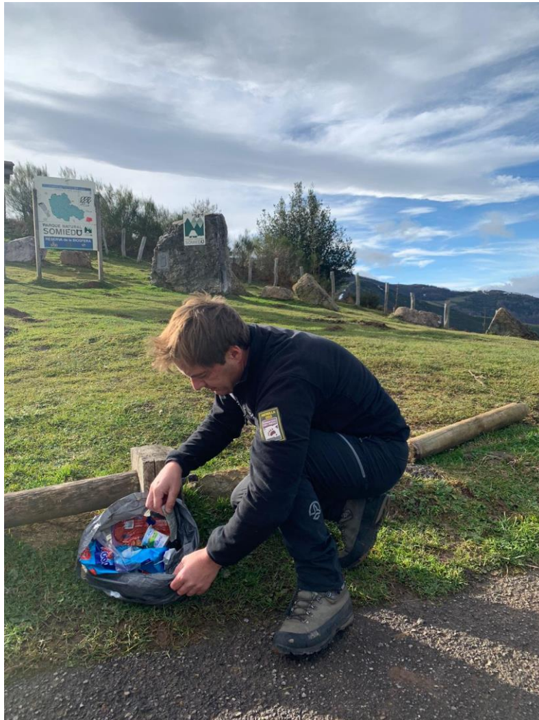
Caracterización de residuos en el Parque Natural de Somiedo (Asturias)

- Parque Natural de Somiedo (Asturias): GR 101 Camin Real de la Mesa (aparcamiento puerto de San Lorenzo). 200m x 12m. Menos de 1kg de peso de envases, papel y cartón, y restos orgánicos.