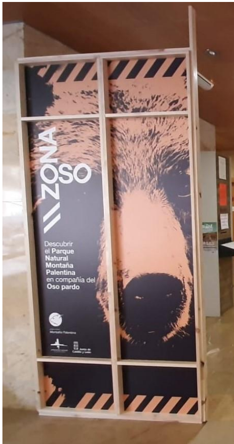
Panel de acceso a la exposición permanente “Zona Oso” en la Casa del Parque de la Montaña Palentina